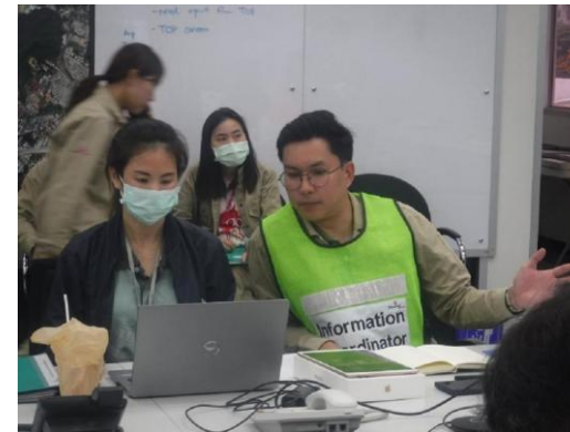
รูปที่ 2-35 ศูนย์สื่อสารเหตุฉุกเฉิน (Information Center)