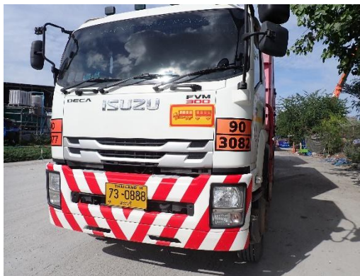
รูปที่ 2-23 รถขนส่งกากของเสียอุตสาหกรรมของโครงการ