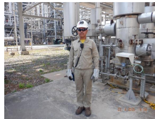
รูปที่ 2-10 คนงานสวมใส่อุปกรณ์คุ้มครองความปลอดภัยส่วนบุคคล