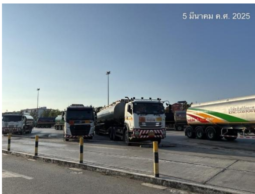
รูปที่ 2-24 ลานจอดรถขนถ่ายผลิตภัณฑ์