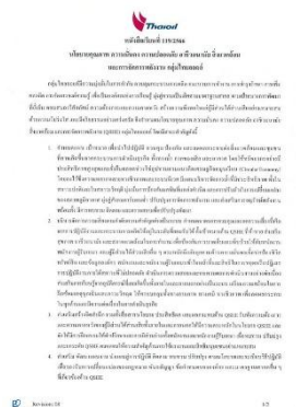
รูปที่ 2-26 นโยบายด้านคุณภาพ ความปลอดภัย และอาชีวอนามัย