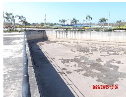
รูปที่ 2-18 บ่อพักน้ำ Retention Pond