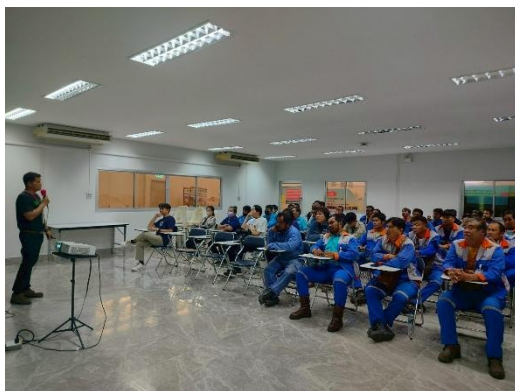
รูปที่ 2-13 การอบรมให้ความรู้ด้านกฎระเบียบความปลอดภัยในการทำงาน