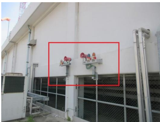
รูปที่ 2-28 ระบบสัญญาณเตือนเหตุฉุกเฉิน