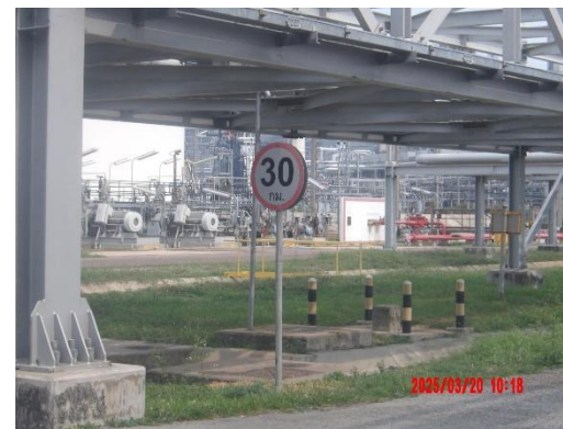
รูปที่ 2-22 บ้ายเตือนให้ควบคุมความเร็วในเขตพื้นที่โรงงาน