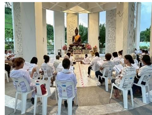
รูปที่ 2-44 การเข้าร่วมกิจกรรมทางศาสนากับชุมชนในพื้นที่