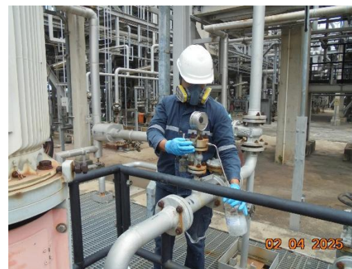
รูปที่ 2-16 บ่อเก็บรวบรวม Process Oily Water Drum