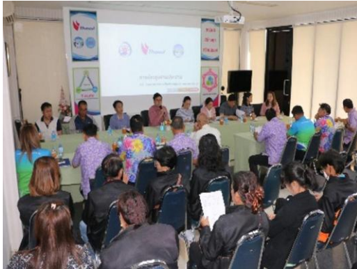
รูปที่ 2-36 การประชาสัมพันธ์ข้อมูลข่าวสารของโครงการ