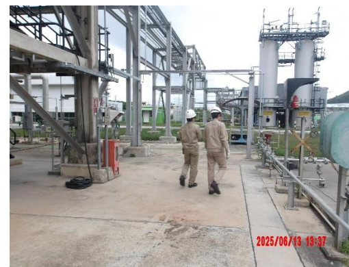
รูปที่ 2-12 พนักงานเดินตรวจสอบภายในพื้นที่กระบวนการผลิต