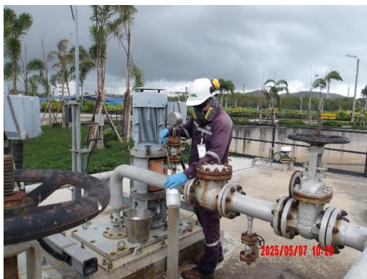
รูปที่ 2-17 บ่อพักน้ำ Oil Separator Pond