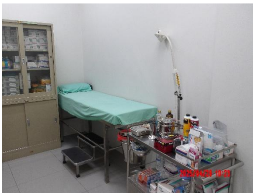
รูปที่ 2-41 (ต่อ) ห้องพยาบาลและอุปกรณ์ปฐมพยาบาลเบื้องต้น