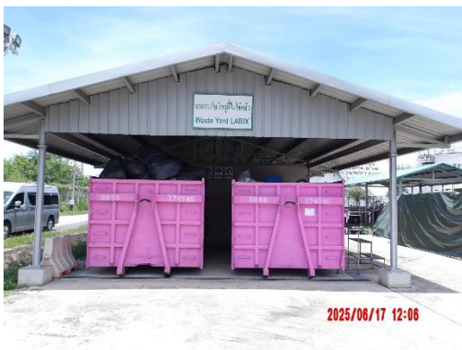
รูปที่ 2-21 อาคารเก็บกากของเสียที่มีหลังคาปกคลุม