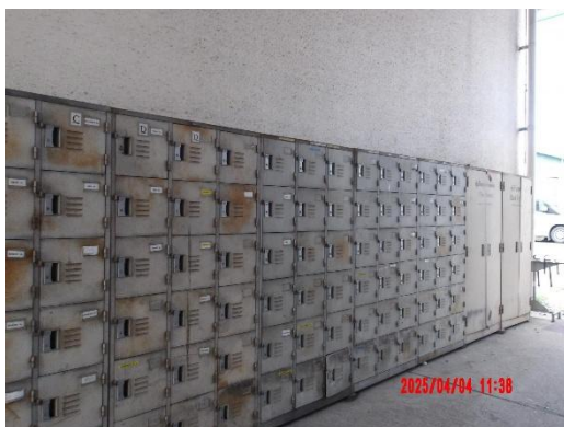
รูปที่ 2-11 อุปกรณ์คุ้มครองความปลอดภัยส่วนบุคคล