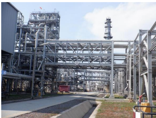
รูปที่ 2-38 การวางท่อน Pipe Rack หรือ Pipe Bridge ในลักษณะที่ปลอดภัย