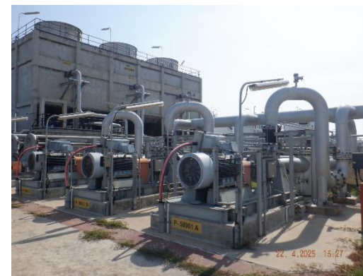
รูปที่ 2-39 Flow Meter