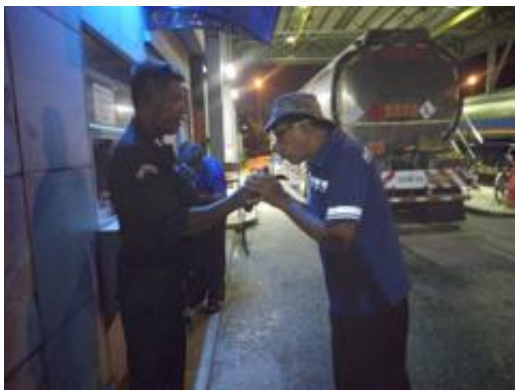
รูปที่ 2-48 (ต่อ) การตรวจวัดแอลกอฮอล์ของผู้ขับและการอบรมความปลอดภัยในการขนส่ง