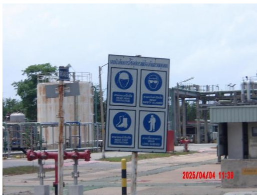
รูปที่ 2-9 ป้ายเตือนให้คนงานสวมใส่อุปกรณ์คุ้มครองความปลอดภัยส่วนบุคคล