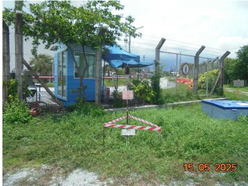
รูปที่ 2-7 การติดตามตรวจสอบระดับเสียงรบกวนโครงการด้านทิศตะวันตก