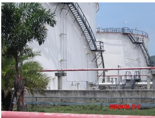
รูปที่ 2-40 Dike Area บริเวณถังเก็บกัก