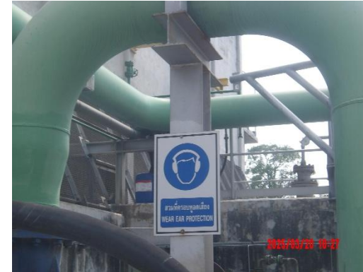
รูปที่ 2-8 ป้ายแจ้งเตือนเขตระดับเสียง