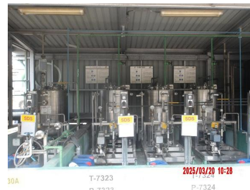
รูปที่ 2-25 บ้ายรายละเอียดเกี่ยวกับข้อมูลความปลอดภัยของสารเคมี ในบริเวณที่มีการดำเนินงานเกี่ยวกับสารเคมีอันตราย