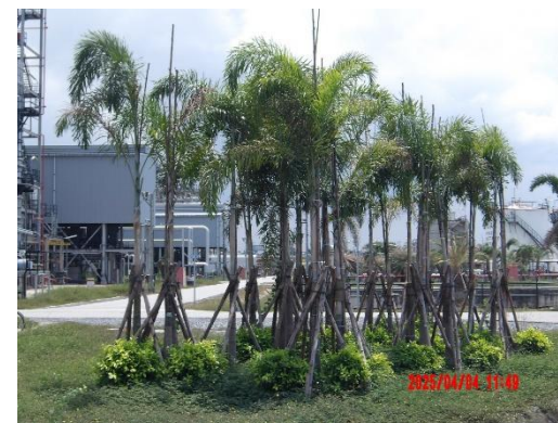
รูปที่ 2-46 พื้นที่สีเขียวของโครงการ