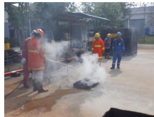
รูปที่ 2-33 การฝึกซ้อมดับเพลิง