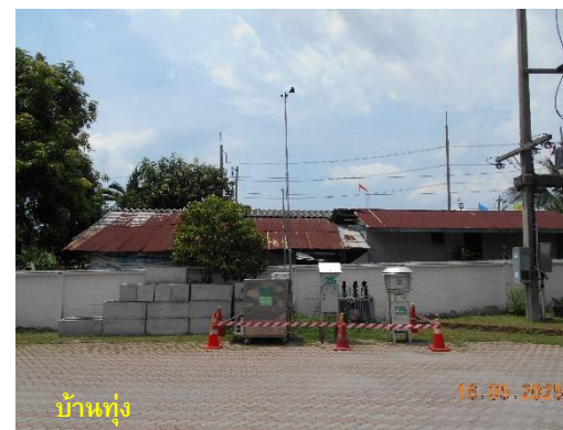
รูปที่ 2-1 กิจกรรมที่เกิดขึ้นโดยรอบจุดตรวจวัดคุณภาพอากาศ