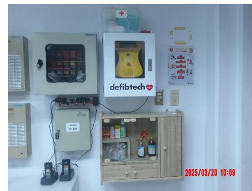
รูปที่ 2-41 ห้องพยาบาลและอุปกรณ์ปฐมพยาบาลเบื้องต้น