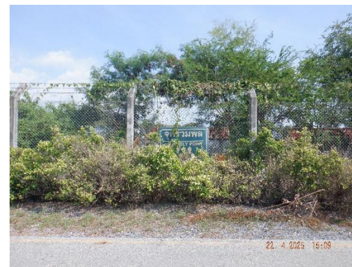
รูปที่ 2-31 จุดรวมพล