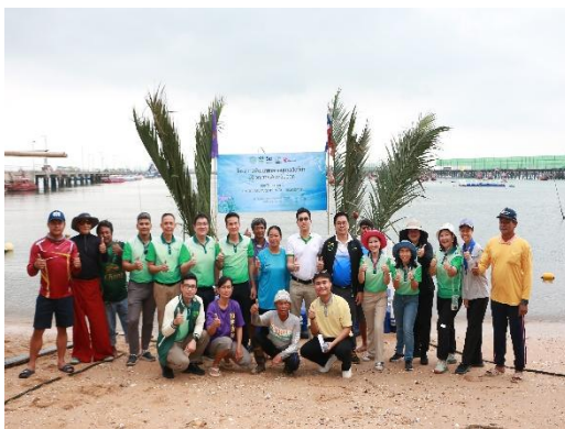
รูปที่ 2-43 การเข้าร่วมกิจกรรมกับทางชุมชนในการปรับปรุงสิ่งแวดล้อม