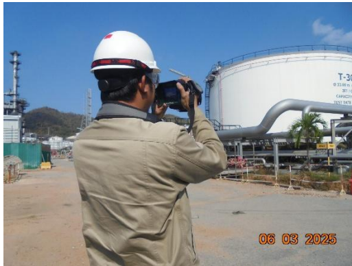
รูปที่ 2-5 การตรวจสอบแหล่งกำเนิดชนิดฟุ้งกระจาย (Fugitive Sources) ในพื้นที่กระบวนการผลิต