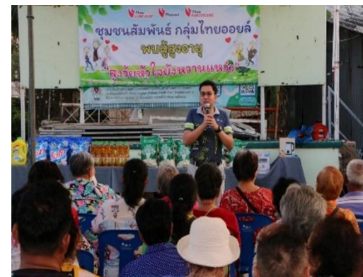
รูปที่ 2-42 การออกหน่วยสาธารณสุขเคลื่อนที่ในชุมชนที่ใกล้เคียงกับโครงการ