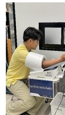
รูปที่ 2-2 การตรวจสอบสภาพประจำปี