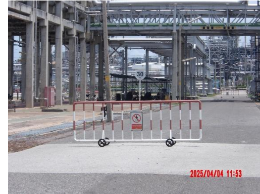
รูปที่ 2-37 เขตพื้นที่หวงห้าม เขตพื้นที่ควบคุม