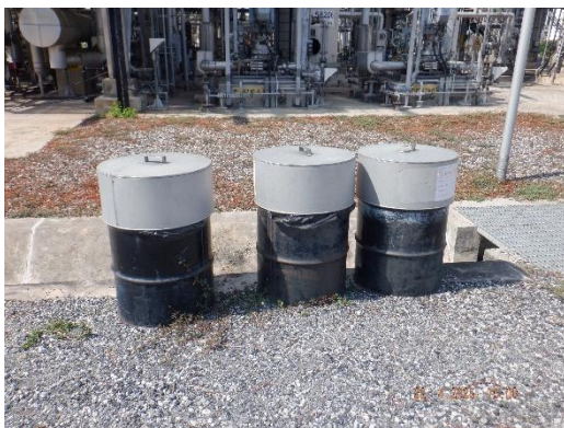
รูปที่ 2-47 ถังขยะภายในบริเวณโครงการ