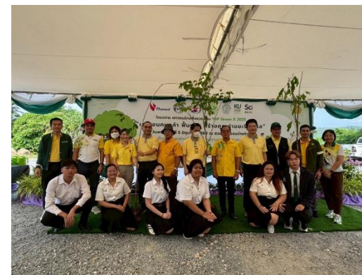
รูปที่ 2-45 การให้การสนับสนุนกิจกรรมด้านการศึกษาของสถาบันการศึกษา