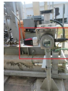
รูปที่ 2-29 ระบบตรวจจบบก๊าซพิษในพื้นที่กระบวนการผลิต