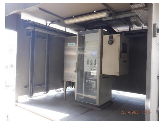
รูปที่ 2-4 การติดตั้งระบบตรวจวัดคุณภาพอากาศแบบต่อเนื่อง (CEMS)