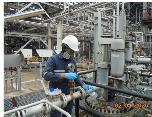
รูปที่ 2-14 ระบบบำบัด Sour Water Stripper-4