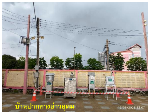
รูปที่ 2-1 (ต่อ) กิจกรรมที่เกิดขึ้นโดยรอบจุดตรวจวัดคุณภาพอากาศ