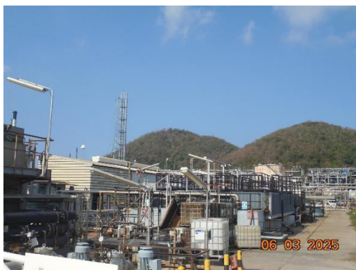
รูปที่ 2-15 โรงงานปรับปรุงคุณภาพน้ำเสียรวม ของบริษัท ไทยออยล์ จำกัด (มหาชน)