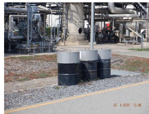
รูปที่ 2-20 ถังขยะที่มีฝาปิดมิดชิด