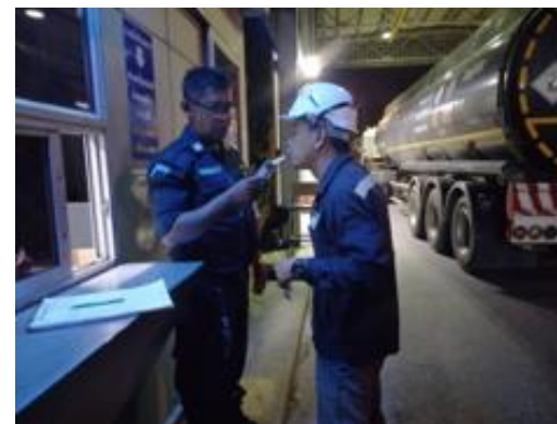
รูปที่ 2-48 การตรวจวัดแอลกอฮอล์ของผู้ขับและ การอบรมความปลอดภัยในการขนส่ง