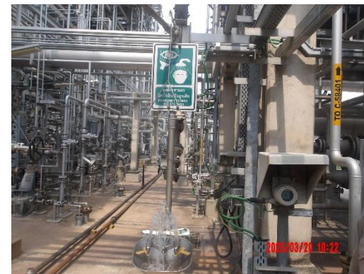
รูปที่ 2-27 ฝักบัวอาบน้ำ ล้างตา จุกเงิน