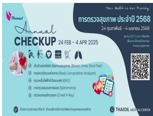
รูปที่ 2-3 การประชาสัมพันธ์เตรียมความพร้อมก่อนการตรวจสุขภาพ