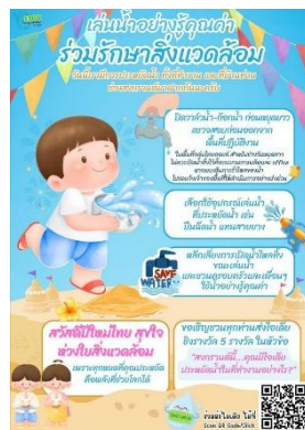
รูปที่ 2-19 ป้ายประชาสัมพันธ์ให้พนักงานใช้น้ำอย่างประหยัด