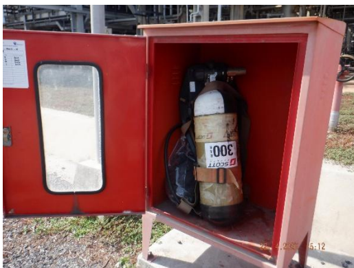
รูปที่ 2-30 อุปกรณ์ป้องกันระบบทางเดินหายใจ (SCBA)