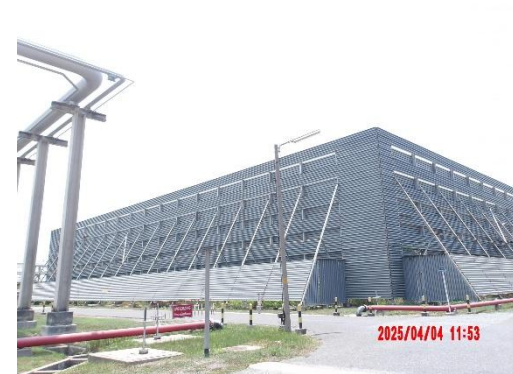
รูปที่ 2-6 ระบบหอเผาของ บริษัท ไทยพาราไซลีน จำกัด