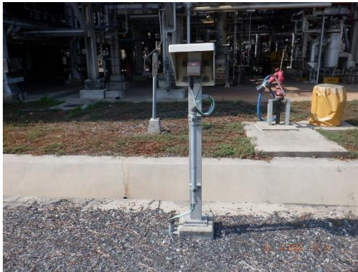
รูปที่ 2-34 จุดแจ้งเหตุเพลิงไหม้